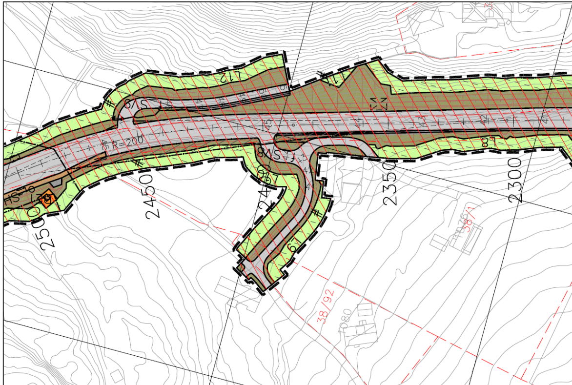
Figur 1 reguleringsplan