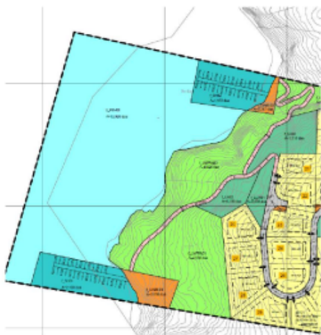
Figur 4: Gjeldande plankart.

Nedunder vert kartendringa knytt til småbåthamna vist :