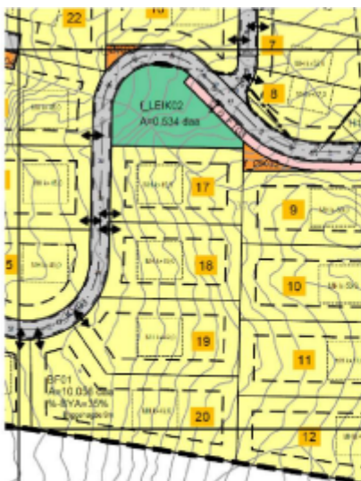
Figur 8: Gjeldande reguleringsplan der tomt 17 - 20 har avkørsler ut i o_KV03.

Nedunder er flyttinga av internvegen til tomt 17, 18, 19 og 20 vist.