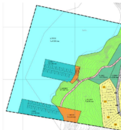
Figur 5: Forslag til endringar i plankart der småbåthamn i nord er flytta lenger sør.