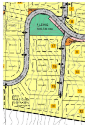
Figur 9: Foreslått endring. Etablering av o_KV05 som gjev tilkomst til tomt 17-20.

I tillegg er det gjort små justeringar som følgje av desse tre endringane. Det vert vist til vedlegg i saka