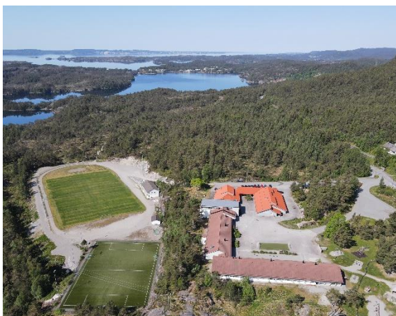
Nordbygda skule og idrettsanlegg på Hosteland

Frå bustadområdet er det 10 minutt med bil til Hosteland der det er butikkar, skule, barnehage, m.m. I Fensfjordbygg finn ein blant anna helsetenester, kafè, politi og NAV.