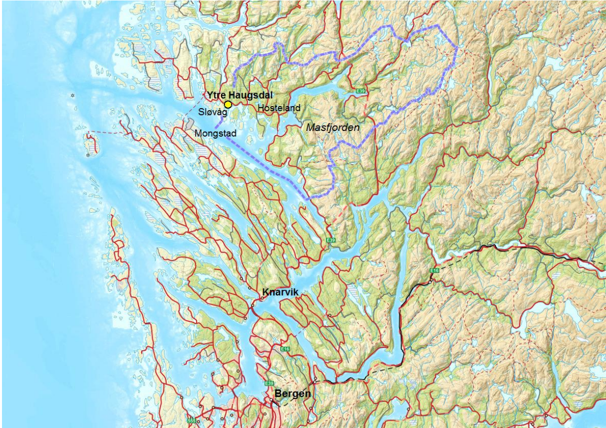
Kartutsnitt som viser Ytre Haugsdal i forhold til Bergen, Knarvik, Mongstad og Sløvåg

Bustadområdet i Ytre Haugsdalen ligg sørvendt mot Fensfjorden med vakker utsikt og gode solforhold. Her er det kort avstand til nydelege naturområde, turterreng og fine badeplassar m.m.